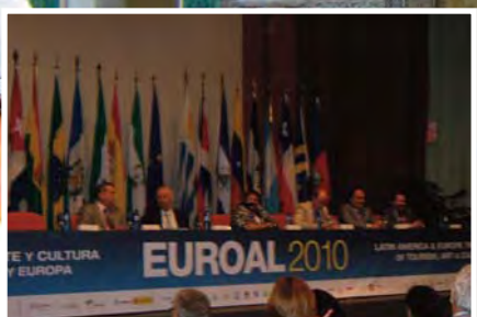
Visión celebra su su primer año desde su fundación (Pág. 10)

Páginas Nacionales e Internacionales en Español e Inglés