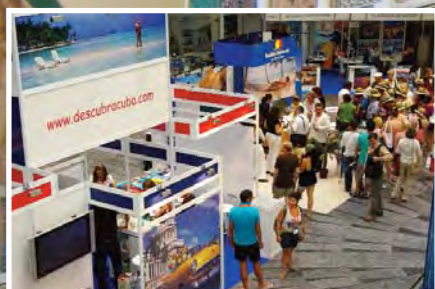
EUROAL 2010 (Pág. 4-6)