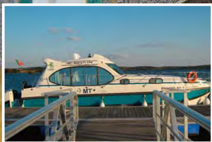
Lago Alqueva Amieira Marina (Pág. 2-3)