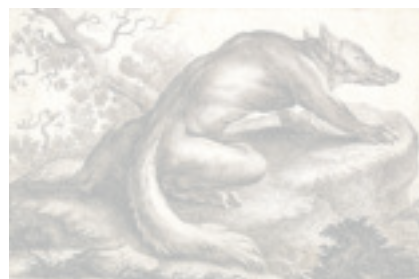
Grabado de un hombre lobo.

En El llop i els humans ( El lobo y los humanos ), el naturalista Josep Maria Massip Gibert rastrea las huellas del lobo ibérico en la memoria oral y escrita, las fábulas y la toponimia de Cataluña, y las agrupa en un muy atractivo volumen de 300 páginas, escrito