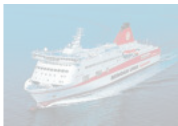
El barco Ikarus , de Grimaldi.

Grimaldi lanzará mañana, 17 de abril, una nueva línea regular de ferry entre Barcelona y Tánger (Marruecos), con salida los domingos a las 23.59 y llegada a la ciudad marroquí a las 10.30 del martes siguiente. Precio por persona y trayecto: 60 euros, tasas incluidas. Descuento del 30%