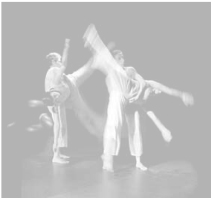
Disque Danza es una de las compañías participantes.

La compañía Teatro Avento presenta, el 10 de mayo, "A insólita historia de Jimmy Pelostristes" en la