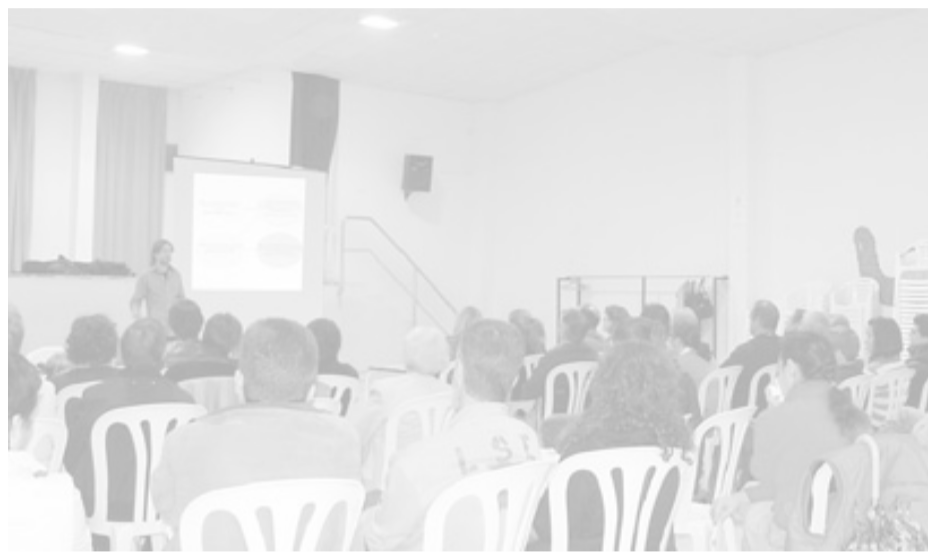
Veïns de Caldes, en una reunió prèvia per crear el Consell del Poble.

La intenció és que la governabilitat es basi en tres pilars: els representants polítics escollits en les eleccions del 2008, la participació ciutadana amb capacitat decisòria i els serveis tècnics de l'Ajuntament. Es tracta, segons el mateix consistori, d'intentar acostar la participació ciutadana a les tasques de govern, no tan sols en