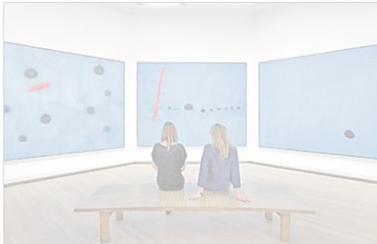
La muestra de Miró ha estado abierta durante seis meses en Londres.

Las muestras temporales con más visitas hasta ahora han sido las de Matisse, Picasso, Edward