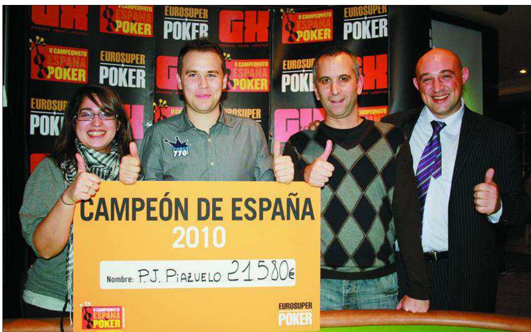
Los tres primeros clasificados del Campeonato de España 2010, tras la prueba celebrada en Valladolid el pasado diciembre.