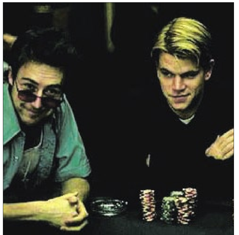
Edward Norton (i) junto a Matt Damon en una toma de la película Rounders