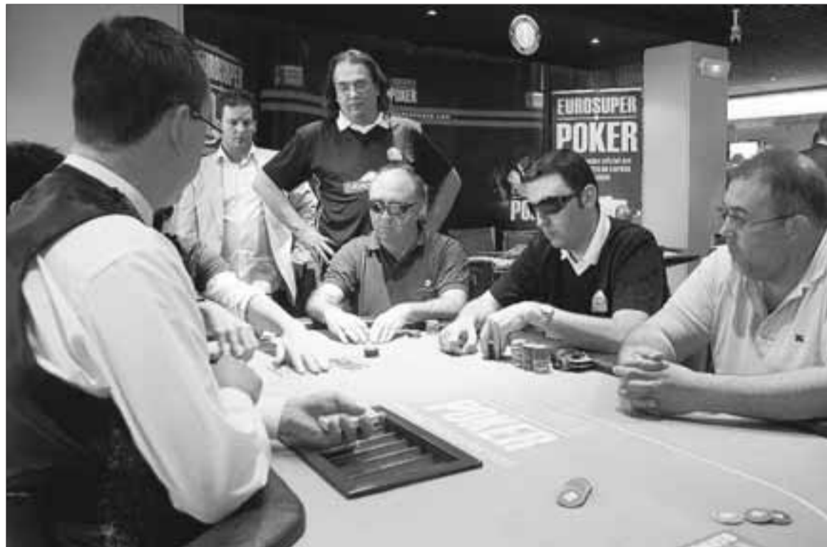
Una de las paradas del campeonato nacional que se celebró el año pasado en Tarragona.

Cada torneo se disputa en 3 días -viernes, sábado y domingo-, siendo el primero de ellos el destinado a jugar el súper satélite para clasificarse para el evento principal. El sábado se disputa el even-