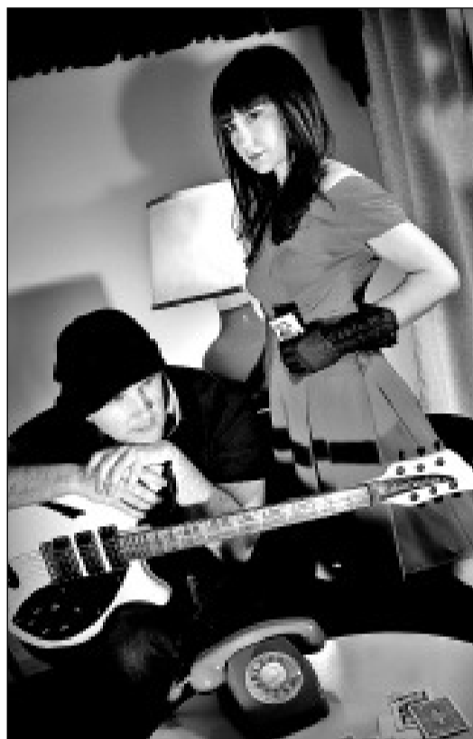
↓ D'esquerra a dreta, imatges dels artistes Amaral, Amparanoia i Pablo Milanés, que actuaran a Tarragona els dies 17, 15 i 19 d'agost, respectivament.

Altres cites musicals seran el festival de l'Associació de Músics de Tarragona (AMT), que de nou disposarà dels jardins de la Chartreuse, el dia 16, per organitzar vuit hores de concerts, amb