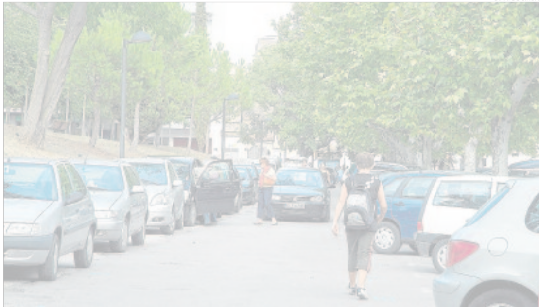
El Passeig Nou de Figueres, a la part sud del Parc Bosc, on es construirà l'aparcament soterrat.

Des de temps memorials era el camí veïnal de Figueres a Avinyonet de Puigventós, que passava per les Pedreres i el veïnat de les Tres Cases d'Avinyonet. Hi havia dues variants, una que anava fins a Palau Surroca i l'altra, a la carretera de Llers. Tenia un entroncament amb el camí, ara carrer de La Pastora, que