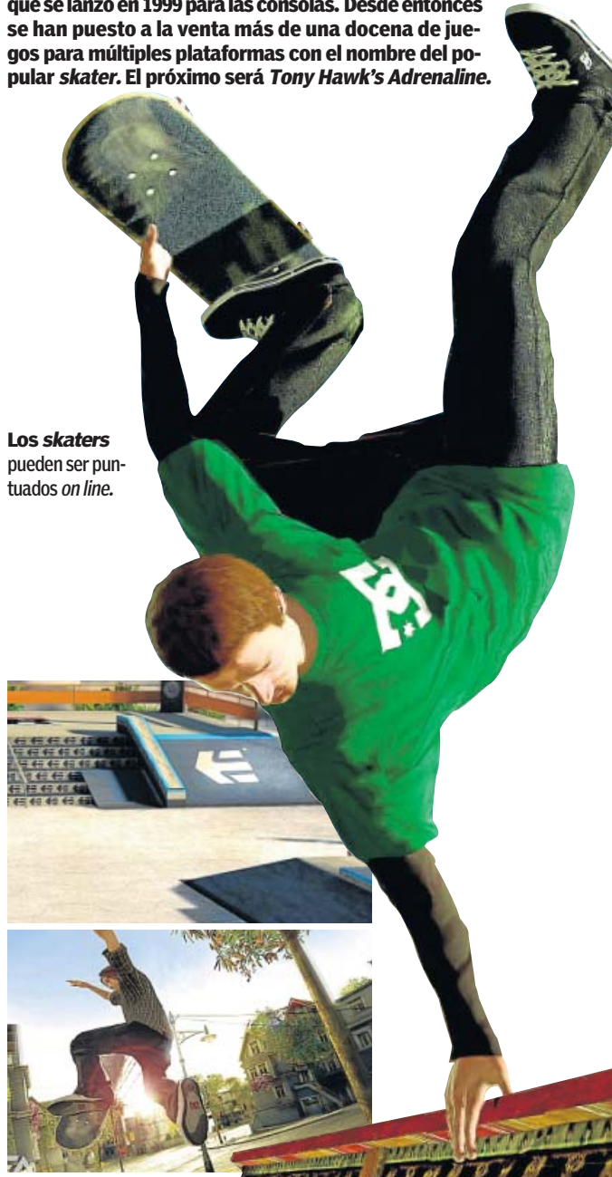
Los skaters pueden ser puntuados on line .

Hasta el lanzamiento de Skate en 2007, la serie de juegos de Tony Hawk era la máxima referencia de este deporte en los videojuegos. El primero de la serie fue Tony Hawk's Pro Skater, que se lanzó en 1999 para las consolas. Desde entonces se han puesto a la venta más de una docena de juegos para múltiples plataformas con el nombre del popular skater. El próximo será Tony Hawk's Adrenaline.