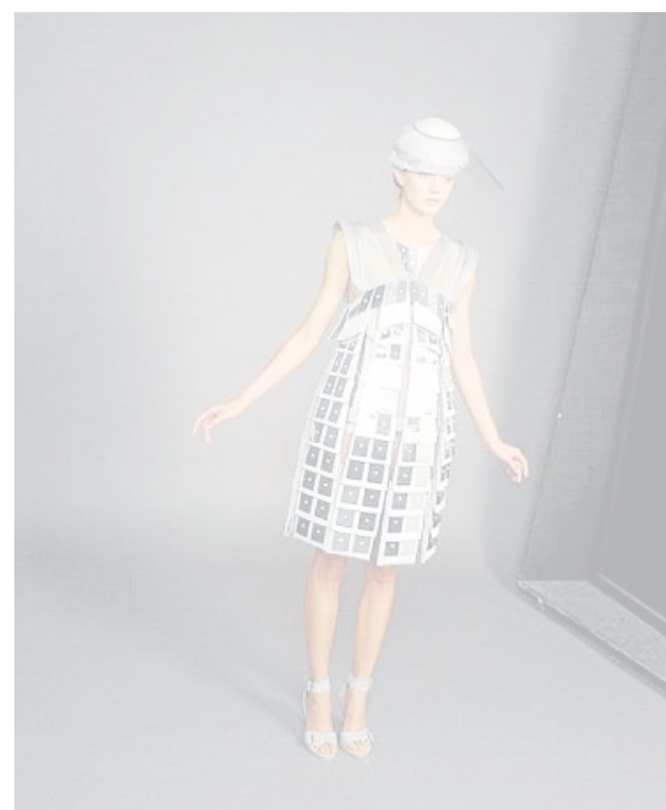
Uno de los desfiles del ModaFad del pasado año.

Mañana sábado tendrán lugar los desfiles del ModaFad de los diferentes alumnos participantes. También se montará el tradicional mercadillo de tendencias, MerkaFad, que tomará el aparca-