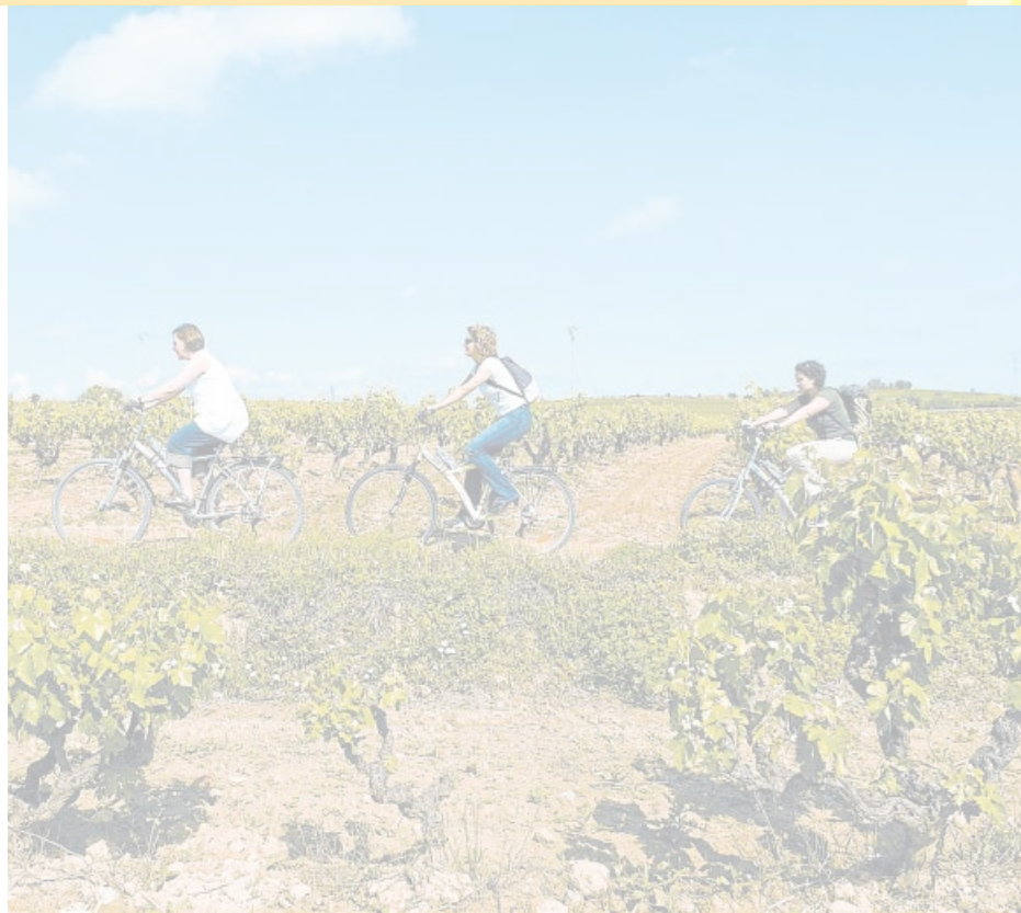
L'enoturisme es pot practicar al Penedès, al Priorat, la Conca de Barberà, el Segre o la Costa Brava.

A banda dels productes de mar i muntanya i els ramaders, l'aviram forma part de la cuina tradicional casolana des de l'Edat Mitjana. A l'Empordà, les Jornades Gastronòmiques de la Cuina