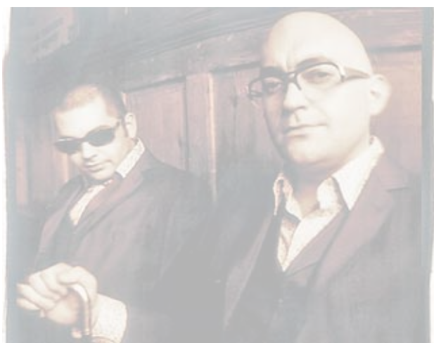
La banda británica está formada por los hermanos Godfrey.

Hoy, 22.00 horas. Espacio Movistar de Barcelona. Entradas: 25 euros.