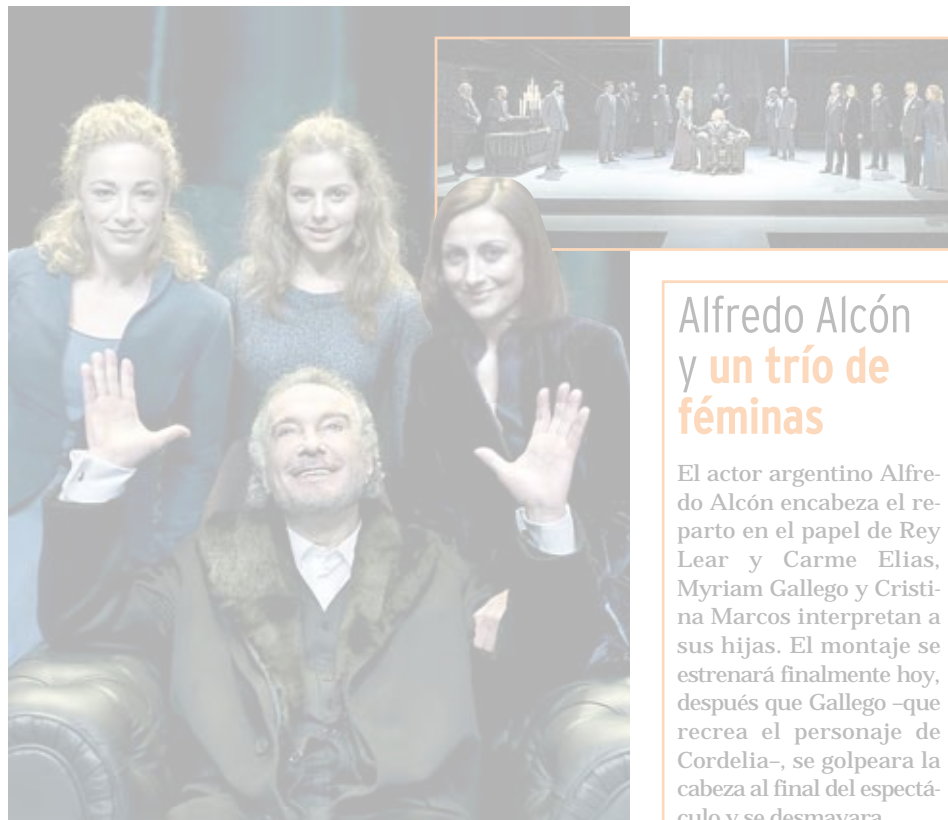
El reparto de 'El Rey Lear'.

Hasta el 8 de junio. Sala Grande del TNC. Entradas: De 13 a 24 euros.