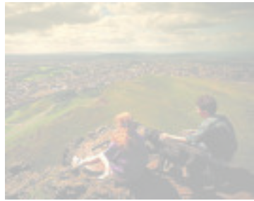
Edimburgo, desde la Silla de Arturo.

La noche del 31 de octubre, Edimburgo celebra el Samhain, la fiesta celta que dio origen a la noche de Todos los Santos, el All Hallow's Eve o Halloween de los países anglosajones. Ese día se organizan visitas guiadas nocturnas a