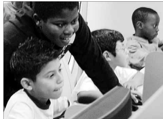
Los niños pueden acceder a contenidos inapropiados.

Los ciudadanos pueden suscribirse a «Alerta BOE», un servicio personalizado de acceso a la información de anuncios de subastas y concursos públicos de obras y servicios del BOE.