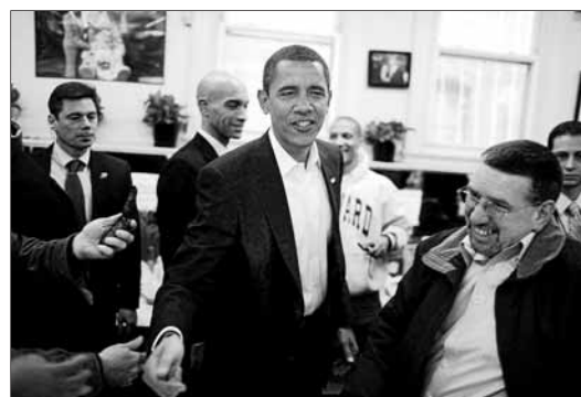
Obama aprovecha las nuevas tecnologías para difundir su política.

Obama, que debe gran parte de su éxito en la campaña electoral de 2008 al uso de la Red para comunicarse con millones de usuarios jóvenes, podría recurrir a Youtube.com de la misma manera que el presidente Franklin D. Roosevelt recurrió a