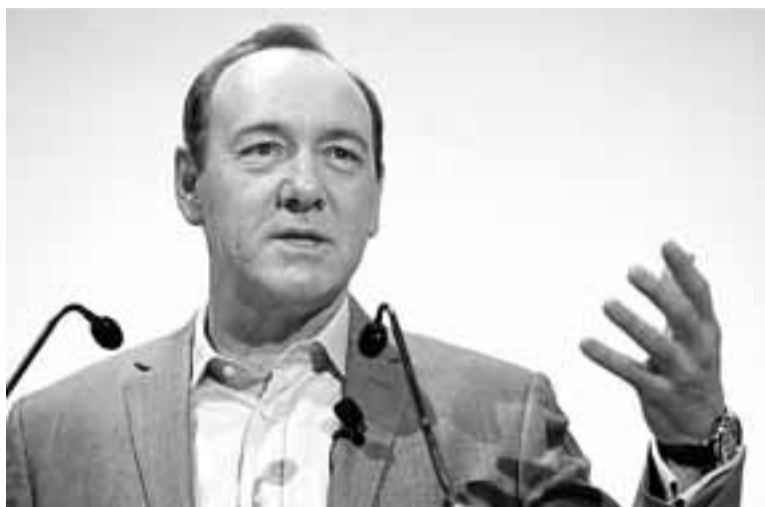
El actor Kevin Spacey, durante su intervención en el foro FICOD.

Y es que www.elportaldemusica.es no permite descargar contenidos, pero enlaza a distintos sites que ofrecen contenidos musicales, gratuitos o de pago, que respetan los derechos de autor: Youtube, Spotify, Rockola.fm, iTunes, MySpace, Yes.fm, NokiaMusic, JetMultimedia o las compañías de telecomunicaciones Movistar, Orange y Vodafone. De momento, 60 de las 90 compañías productoras que integran Promusicae se han sumado al proyecto, que cuenta con el apoyo del Ministerio de Industria, Turismo y Comercio. La ministra de Cultura, Ángeles Gon-