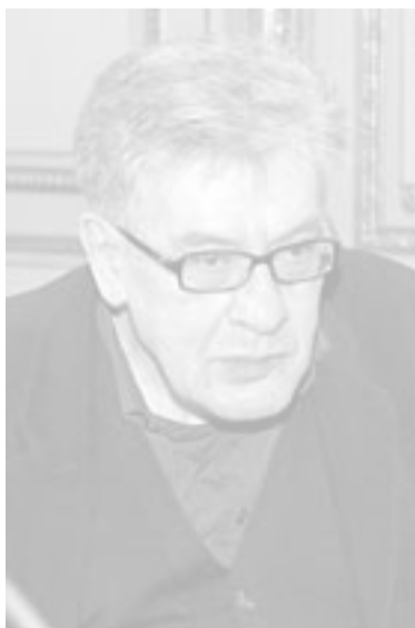
José Emilio Pacheco.

Un prestigioso premio a toda su trayectoria, pero que, en su opinión, es un galardón también para toda la poesía mexicana y latinoamericana, "que es muy buena comparada con la situación social que vivimos". "Sólo se me ocurre que escribimos poesía porque es una forma de resistencia contra la barbarie", sentencia. Y es que este poeta, además de tremendamente humano, es un claro observador de la realidad, "un pesimista, al tiempo que vitalista", preocupado por la condición humana, que luego vuelca en su poesía, sus narraciones y sus ensayos. "Escribo sobre lo que veo -argumenta- y lo que veo no es para sentirse optimista. Ahora hay un nuevo matiz que no existía antes, una crueldad nueva. Por ejemplo, antes había venganza entre los gánsteres, pero a las mujeres y a los niños se les respetaba. Ahora aparecen los