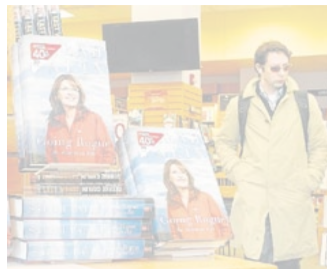
La obra de Palin en una librería de EEUU.