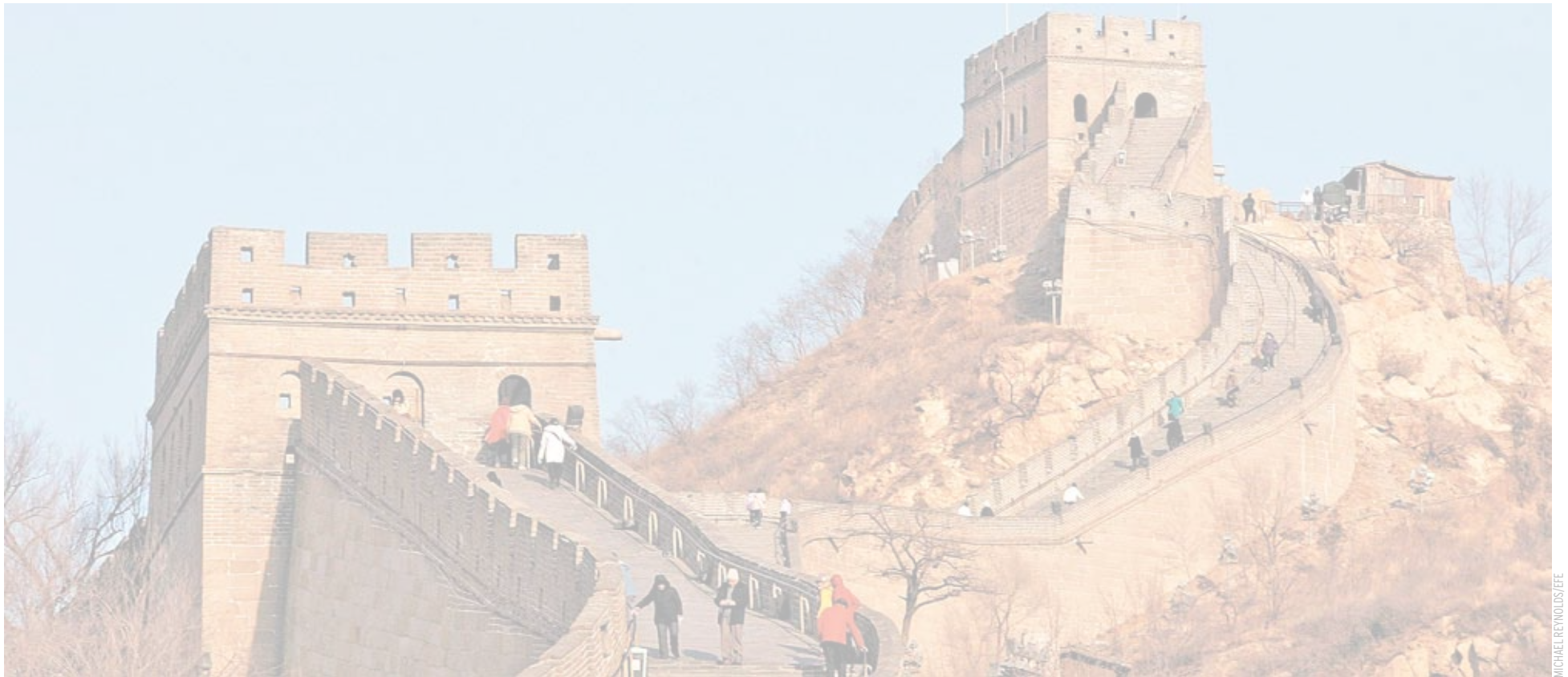
China es uno de los destinos lujosos para esta Semana Santa en la que podrás descubrir su cultura, su gastronomía y, sobre todo, la Gran Muralla.