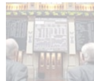
Imagen de la Bolsa Madrid.

MADRID. Las 14 mayores empresas que cotizan en el principal índice de la Bolsa española, el Ibex 35, ganaron el año pasado 40.000 millones de euros, un 20% menos de los 50.000 que lograron en el ejercicio de 2008.