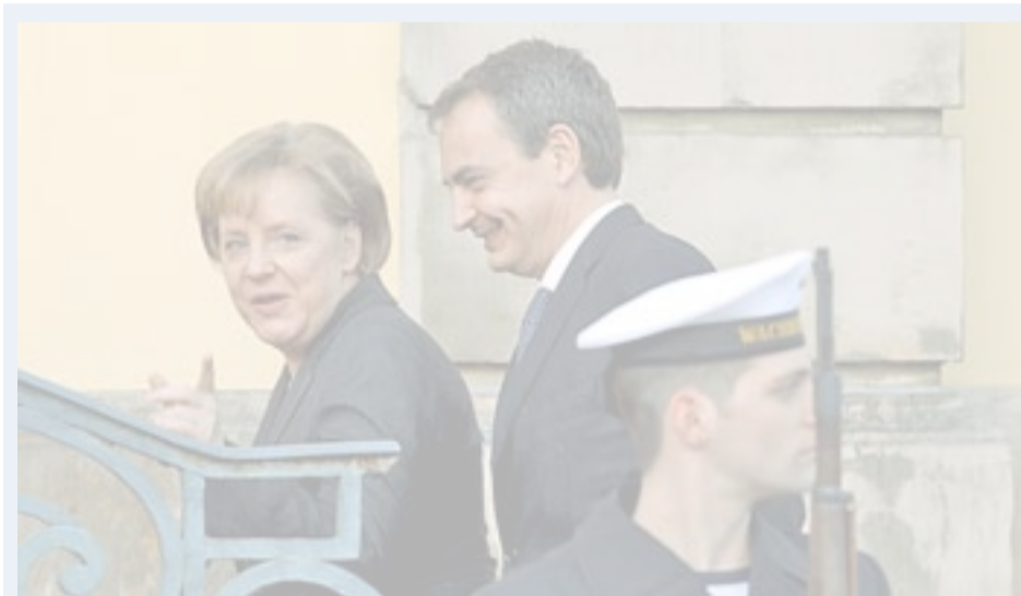
Rodríguez Zapatero y Angela Merkel, ayer en Hannover tras su reunión.

Para generar empleos, el Gobierno propone potenciar la rehabilitación de la vivienda, con la reducción del IVA hasta el 8% a partir de julio. También se deducirá del IRPF el 10% de los costes de las obras de me-