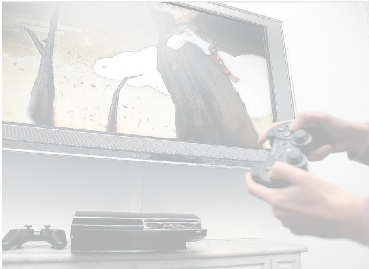
► Una versió antiga de la PlayStation 3, un dels models afectats.

Els fòrums de webs especialitzades estaven plens de missatges de jugadors afectats. Alguns comparaven la situació amb la de l'efecte 2000, perquè es tracta d'un error de software vinculat a un canvi de data (en aquest cas, del 28 de febrer a l'1 de març). Una de les conseqüències que més lamentaven els afectats era la desaparició dels trofeus aconseguits en les partides. Alguns testimonis asseguraven que havien tin-