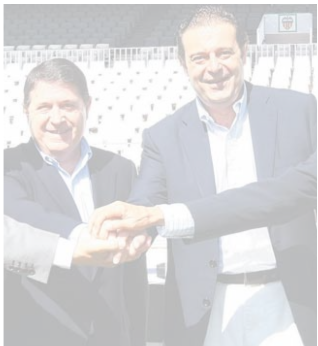
El presidente de Bancaja y el vicepresidente económico del Consell.