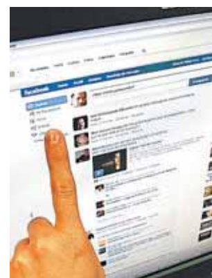
Hemos caído en las redes.

son las Islas Baleares, con un 90% de penetración, seguida de Cantabria (85,2%). En la Comunitat Valenciana, al igual que en el resto de autonomías, la red social favorita es Facebook, seguida de Tuenti (34%) y Twitter (18,5%).