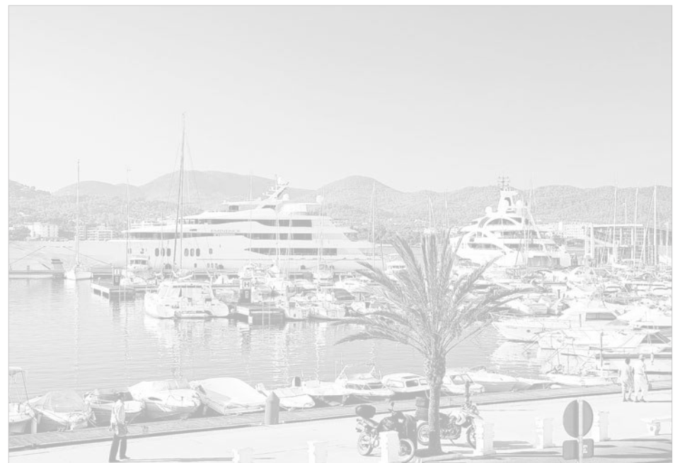
El atraque de dos yates de estas características es poco habitual en el puerto de Sant Antoni.

La imagen del puerto de Sant Antoni con dos yates de estas características es una estampa muy poco habitual que destaca por estos días en la bahía.