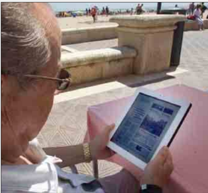
Un usuario, ayer en la playa de la Malvarrosa, lee la edición de EL MUNDO Valencia a través de la aplicación Orbyt en su iPad.