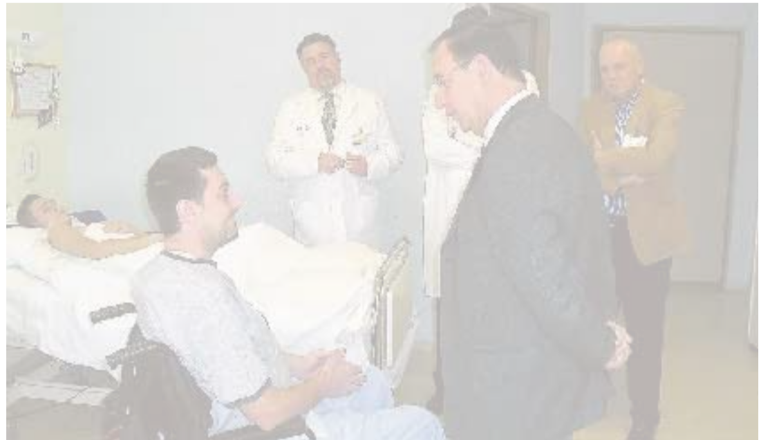
El consejero Bascuñana conversa con los pacientes.

El mundo de la empresa cuenta desde el pasado 1 de febrero con un nuevo colectivo que refuerza el asociacionismo profesional en