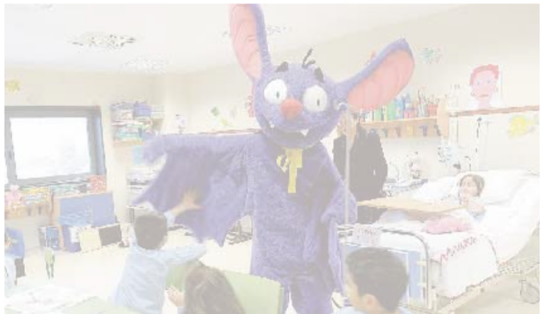
La editorial organizó un espectáculo para promocionar sus libros en la Arrixaca.