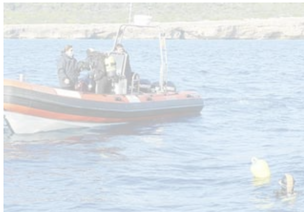
Els tècnics de la Conselleria instal·laren els ordinadors.