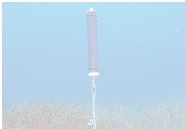
Els POD detecten els cetacis amb hidròfons.

Per enregistrar el moviment dels dofins, ahir es van instal·lar tres POD, un al sud de la reserva, un altre dins la reserva integral i un altre a la part nord, però ja fora de la reserva. Un cop