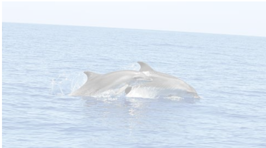
La presència de dofins en la reserva pot beneficiar el fons marí.