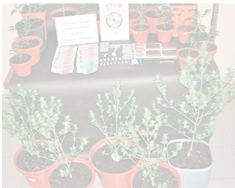
Algunas de las plantas de marihuana incautadas a la pareja avilesina.

Ocupaban dos habitaciones de su vivienda para las plantaciones de marihuana. La Policía Nacional incautó en un piso en el barrio de Jardín de Cantos, en Avilés, 19 plantas y 28 esquejes de 'maría', además de 250 dosis de cocaína y 280 gramos de hachís, desmantelando así un importante punto de venta de droga en la ciudad. Fue detenida una pareja, que fijaba sus citas y encargos por teléfono, dando todas las facilidades a sus clientes para la entrega de la mercancía. La mayoría de sus compradores eran jóvenes vecinos de la villa.