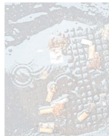
Colillas en una acera.

EP/ La ordenanza municipal de medioambiente de Gijón contempla sanciones de entre 6 y 30 euros para los que tiren colillas al suelo. La alcaldesa de Gijón considera que "no será necesario" aplicarla al apelar a la responsabilidad de los ciudadanos. Apuntó que instalarán más papeleras con ceniceros en las calles dentro de una campaña especial. Felgueroso aseguró que una ciudad llena de colillas no da una buena imagen a los "turistas ni a los gijoneses".