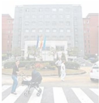
Entrada al Hospital Central.

La Policía Nacional de Oviedo detuvo a un joven dominicano como presunto autor de lesiones con un arma blanca a un hombre en el interior de un bar en Pumarín. El agredido continúa aún recuperándose de las heridas en el HUCA. El detenido, tras conocer que era buscado por la Policía, se personó en la Jefatura Superior de Policía de Asturias. Contaba con cuatro detenciones anteriores.