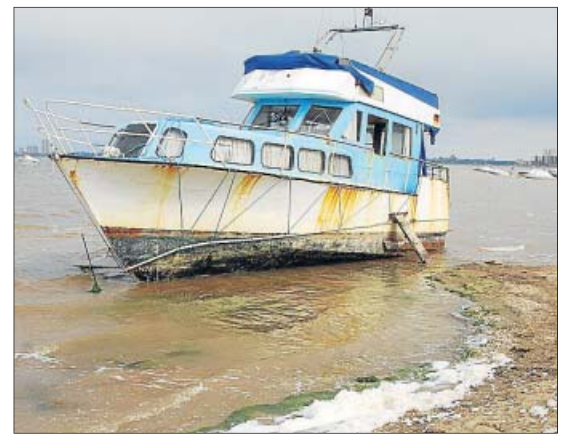
Barco varado en el puerto Tomás Maestre.