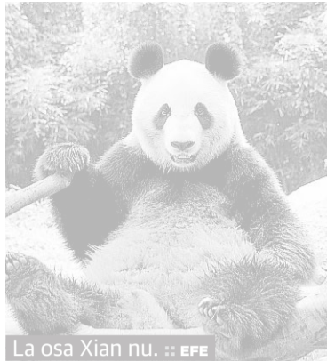
La osa Xian nu.

La osa panda 'Xian nu' ha partido desde China y ha posado antes de viajar hacia su nueva casa en Japón. Xiannu y su pareja han partido ayer de la provincia de Sichuan, en el suroeste de China, con destino a Japón, donde permanecerán diez años en un proyecto de investigación sobre especies en peligro de extinción, informó la agencia oficial Xinhua. 'Xian Nu' y 'Bi Li', ambos de cin-