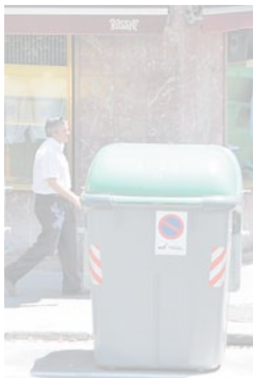
La recogida de vidrio, la más ruidosa.

La medida se enmarca dentro de la nueva ordenanza municipal de medio ambiente, que se aprobará definitivamente este viernes en el pleno. Entre sus puntales, destaca la mejora de la regulación del ruido y la promoción de la energía solar fotovoltaica.