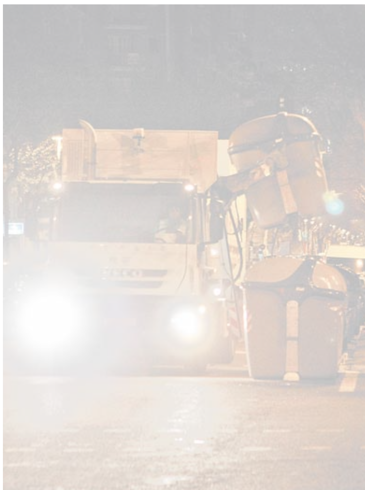
La mayoría de camiones pasan por la noche, a partir de las 20 horas.

Los camiones de basura de Barcelona amargan el primer sueño de muchos ciudadanos. Con la puesta en marcha del nuevo servicio de limpieza, hace poco más de un año, se incrementaron en un 14% los contenedores en la vía pública y, por consiguiente, los trabajos de recogida. No se hacen todos a la vez, sino que un vehículo vacía la orgánica, otro se encarga de los contenedores grises y además, no todos los días, se limpia la calle a manguerazos o se lava el contenedor. Todo, a partir de las 20 horas, y en muchos casos, más allá de las doce de la noche. La molestia es tal que la Sindicatura de Barcelona, que recibió el año pasado casi un centenar de quejas por ello, recomienda al Ayuntamiento "que se vaya incrementando el número de calles en las que se haga la recogida diurna" y también "que se culmine un estudio de los vehículos más ruidosos y las zonas más acusadas y que se apliquen medidas para reducirlo".