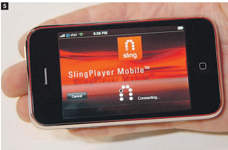
NUEVOS 'GADGETS' PARA EL NUEVO CINE. 1. Steve Jobs, durante la presentación de Apple TV. 2. Una mujer manipulando una pantalla táctil. 3. Un visitante de la Feria de Electrónica de Las Vegas, en el 'stand' de Motorola. 4. Imagen de un iPad con canales multimedia. 5. Las tabletas y los móviles inteligentes ya permiten comprar y visualizar películas 'online'. 6. RIM ha lanzado su dispositivo BlackBerry PlayBook, una tableta preparada para ver cine en 'streaming'.

Es decir, que el gratis total no es la principal motivación que lleva a los internautas a bajarse películas y series de manera ilegal en Internet. De hecho, dos tercios de los 7.000 encuestados por la compañía Core Data afirman que estarían dispuestos a pagar por descargar estos contenidos si existieran más sistemas legales. Es, por tanto, algo más que una cuestión de piratería.