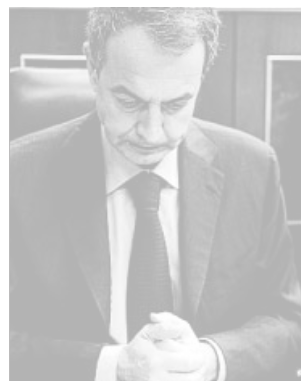
Rodríguez Zapatero, ayer en el Congreso de los Diputados.

está casi todo el arco parlamentario, que suma 168 escaños: PP (153), PNV (6), ERC-IU-ICV (5), BNG (2), Nafarroa Bai (1) y UPyD (1). La abstención de CiU (10), Coalición Canaria (2) y UPN (1) permitirá que la medida, en principio, sea aprobada por tan ajustada mayoría. Y eso, si no hay sorpresas.